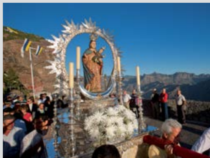
Virgen de la Cueva

Desde comienzos del siglo XVIII se celebra esta fiesta el 14 de septiembre en el barrio de Acusa, congregando a numerosos romeros que acuden a cumplir sus promesas. Y por último, pero no menos importante, es la Candelaria de Acusa. Se celebra el segundo domingo de octubre, devoción arraigada desde el siglo XVII.