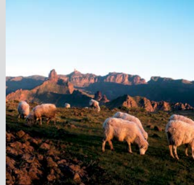
Llano de Acusa Verde con los Roques de Bentayga y Nublo al fondo