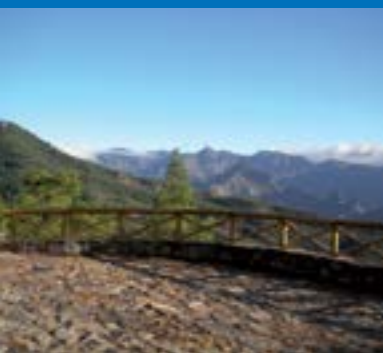
Vista Parque Natural de Tamadaba

Otros lugares de interés en Artenara, son El Poblado Aborígen de Acusa Seca , junto con otros conjuntos de cuevas prehispánicas importantes por tener grabados rupestres como Cuevas Caballero , Los Candiles , El Cagarrutal y Risco Caído . También es buena idea dirigimos al Parque Natural de Tamadaba o recorrer uno de los innumerables senderos existentes.