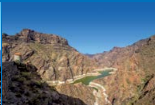
Mirador del Molino