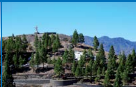
Escultura del Sagrado Corazón de Jesús