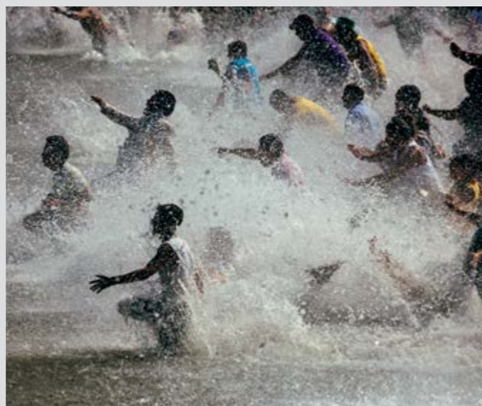
Fiesta del Charco