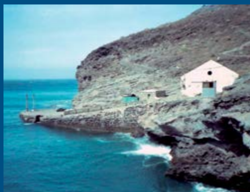
Centro de visitantes Micro Área marina El Roque

Playas de Guguy (Gúi-Güi) Se accede a ellas sólo caminando o en barco. Se trata de la ruta de senderismo más atractiva de la isla de Gran Canaria. Visitar esta playa donde no llegan los vehículos, constituye todo un reto y una aventura. La magia del paraíso más recóndito y salvaje de Gran Canaria. El Charco como espacio natural y etnológico es el símbolo de este pueblo. El lugar es un ecosistema-humedal situado en la orilla del mar, donde se celebra esta fiesta popular cada 11 de septiembre.