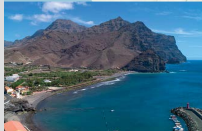
Playa de La Aldea