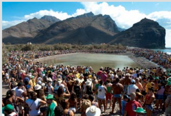
Fiesta del Charco

Es el símbolo de este pueblo y se celebra en la Playa de La Aldea cada 11 de Septiembre a las 17:00 h. Esta gran fiesta se deriva de una técnica de pesca aborigen que se conoce como "embarbascada" (consistía en aturdir con el látex de la tabaiba y el cardón a los peces que se encontraban en los charcos del litoral, para posteriormente capturarlos con las manos sin ningún tipo de dificultad). Esta fiesta es única en su origen y constituye una de las manifestaciones festivas más importantes que se celebran en Canarias.