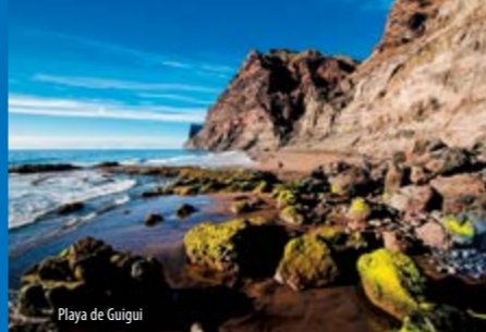
Playa de Guigüi

El muelle se construyó en la misma playa principal, sobre una plataforma rocosa con área de poco calado. Fue una obra hecha con mampostería de piedra con argamasa de cal y arena revestida con cantería. Plataforma irregular, adosada al antiguo cantil con una rampa ascendente hasta dicho almacén.