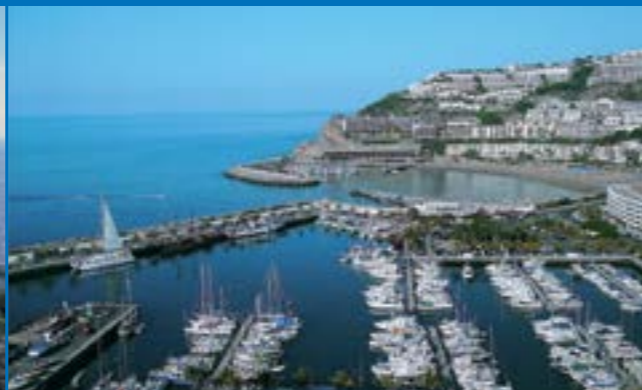
Playa de Puerto Rico

El municipio de Mogán es eminentemente turístico, por lo que las visitas más frecuentes se realizan a las playas que se despliegan en su costa y que actualmente se han configurado como seis urbanizaciones turísticas: Arguineguín-Patalavaca, Anfi del Mar, Puerto Rico - Amadores, Tauro - Playa del Cura, Taurito y Puerto de Mogán. En todas ellas destacan instalaciones hoteleras y restaurantes que bordean con avenidas y paseos a cada una de las playas.