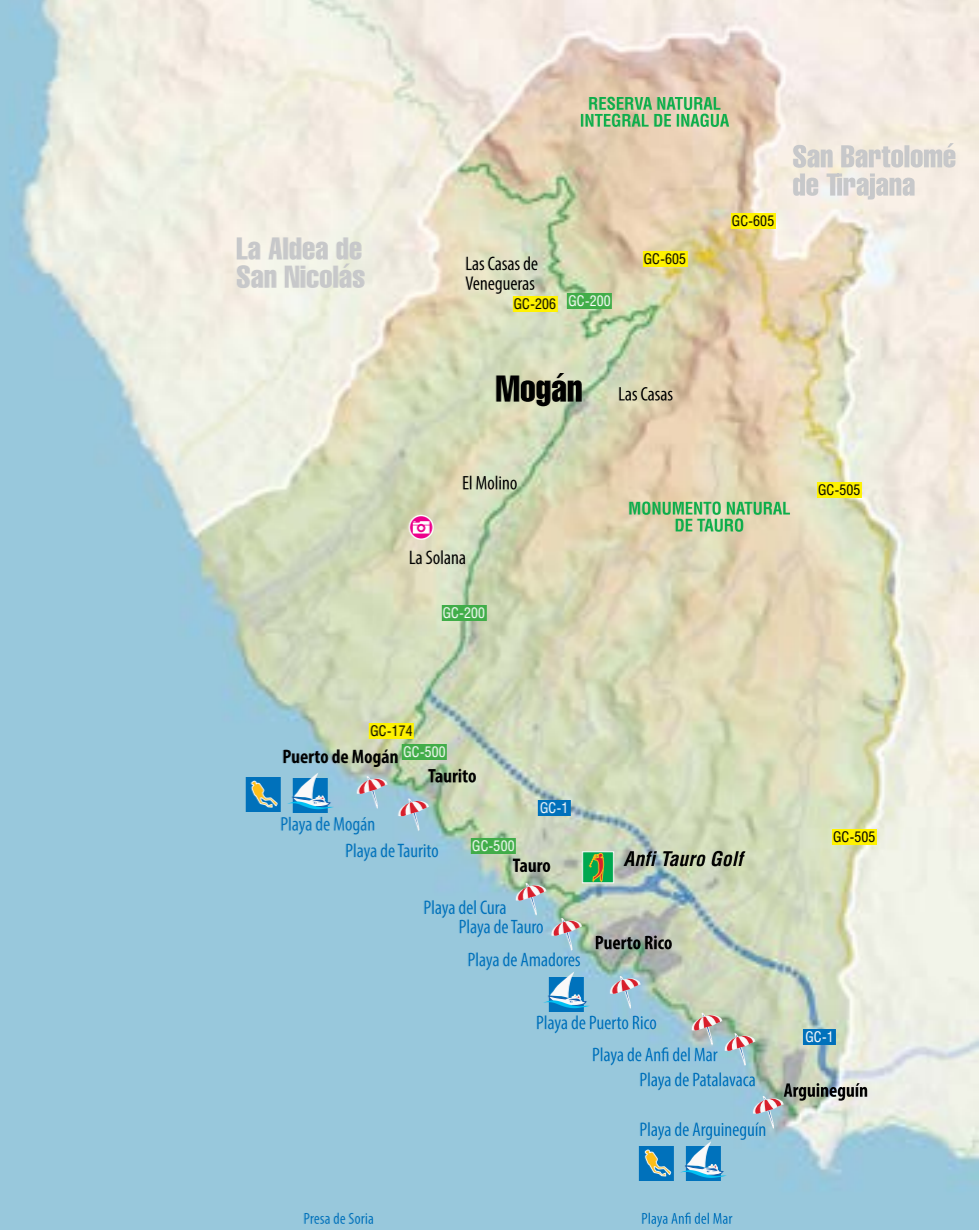
Presa de Soria