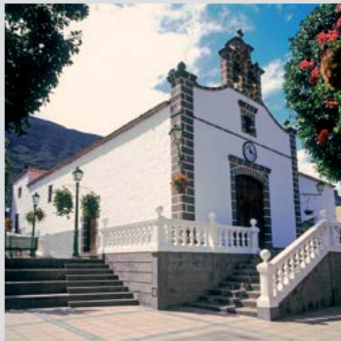
Iglesia de San Antonio

Se celebran en julio en Arguineguín y en agosto en Puerto Mogán. Uno de los actos más conocidos y con mayor participación es la procesión marítima. Ese día, la costa de Mogán se llena de embarcaciones de recreo y barcos pesqueros para acompañar a la Virgen del Carmen en su visita a su homóloga en Playa de Mogán.