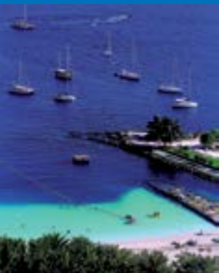
Playa de Anfi del Mar