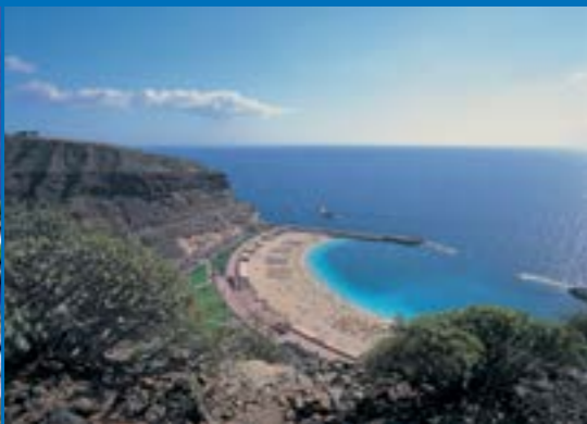
Playa de Amadores