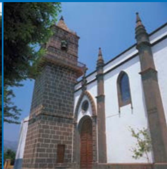
Iglesia Parroquial de Santa Brígida