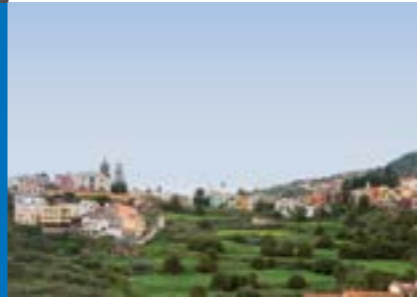
Casco Histórico de Santa Brígida

El municipio, con una extensión de 23,8km², está situado en la zona centro-oriental de la isla de Gran Canaria.