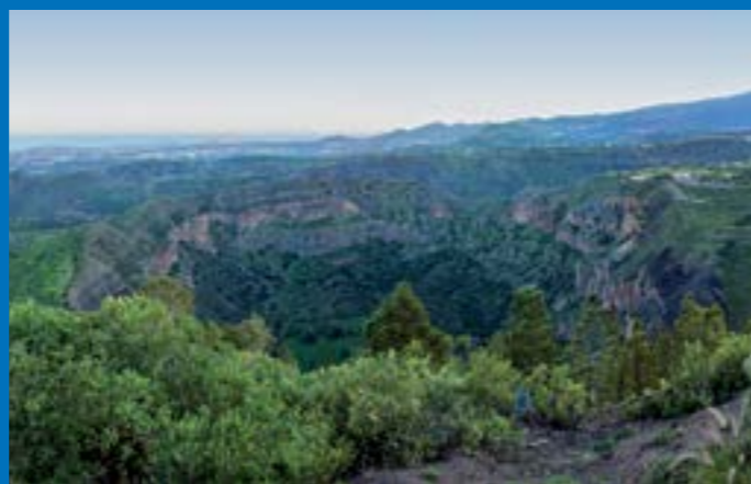
Caldera de Bandama

Desde el barrio de la Atalaya nos podemos dirigir al Casco Histórico del municipio, donde es fácil ver la Iglesia Parroquial si se pasea por el pueblo. En sus alrededores, Santa Brígida ofrece paisajes de extraordinaria belleza y entre otros lugares se pueden visitar: El Parque Agrícola El Guiniguada, la Casa-Museo del Vino, así como observar edificaciones tales como la Heredad de Aguas de Satautejo y la Higuera, el Real Casino, y la Fonda de Melián.