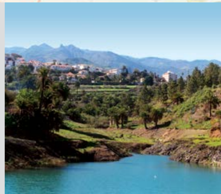
Presas de Satautejo

Las líneas que ofrecen sus servicios en el municipio son la Línea 24, 301, 302, 303, 311, 318 y 331 .