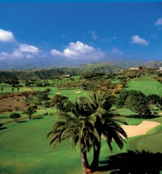
Real Club de Golf de Las Palmas