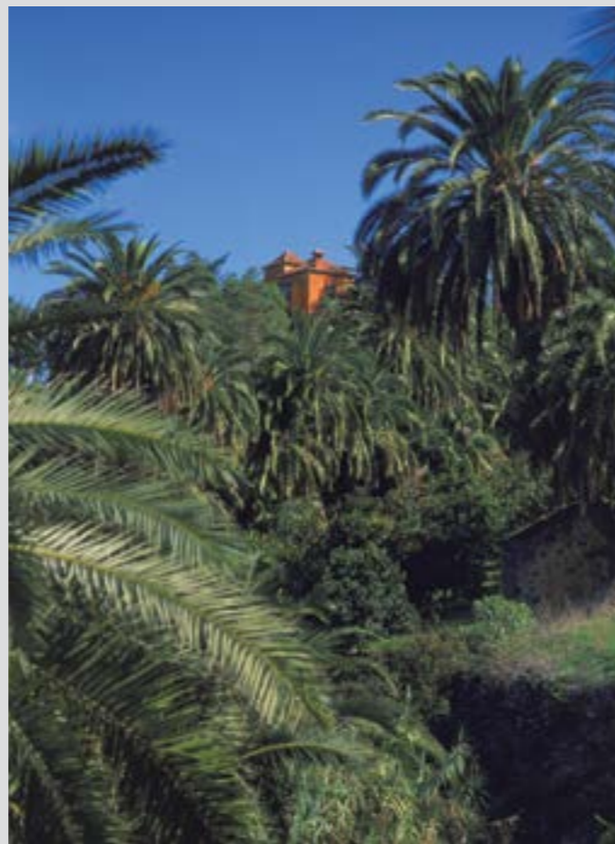
Palmeral de Santa Brígida

Se trata de la fiesta más antigua del municipio. En el segundo tercio del siglo XVI, la fundadora del pueblo, Isabel Guerra, dejó escrito en su testamento la celebración de una fiesta en honor a la Santa, tras edificar la primera ermita. La romería es de 1957. Se celebra el primer fin de semana de agosto con una romería ofrenda, en la que participan todos los barrios con carrozas engalanadas con motivos típicos y con romeros, magos y parrandas.