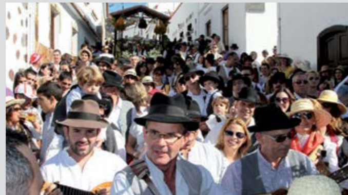
Romería de Los Labradores