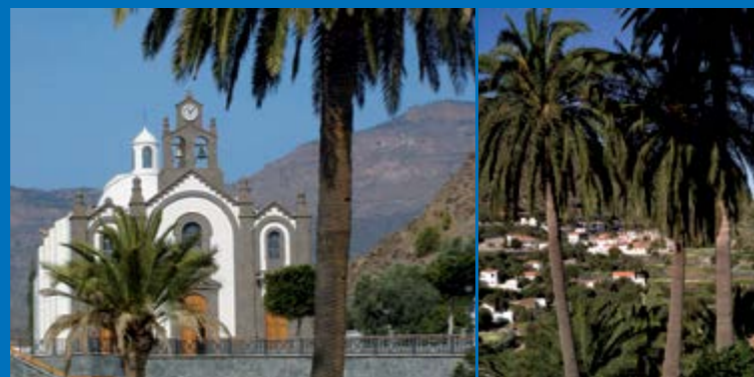
Iglesia de Santa Lucía

En el mismo barranco, a pocos metros de la Fortaleza, encontramos la Presa de Tirajana de gran singularidad paisajística al encontrarse rodeada de bellos y extensos palmerales.