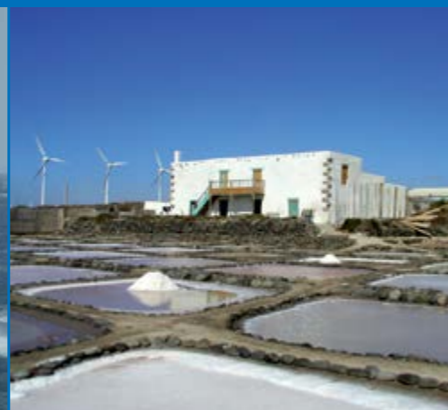
Salinas de Tenefé