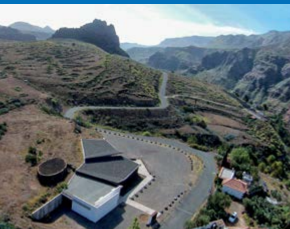
La Fortaleza de Ansite

El municipio de Santa Lucía linda con el mar. En su costa dispone de una playa que está considerada como una de las principales para la práctica del windsurfing. Se trata de la Playa de Pozo Izquierdo, caracterizada por ser una zona frecuentemente azotada por los vientos, que ha sido elegida como uno de los puntos principales de celebración del campeonato mundial de windsurfing.