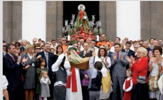
Ofrenda a la Virgen de Santa Lucía

El día 24 de octubre se celebra en la zona de Vecindario la fiesta en honor a San Rafael, declarada fiesta local del municipio y que cuenta entre otros actos tradicionales con una formidable feria de ganado.