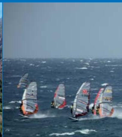
Windsurf en Pozo Izquierdo