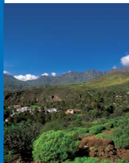
Vista panorámica de Santa Lucía

Situado en el Sureste de la Isla a 680 metros sobre el nivel del mar. Dista 51 kilómetros de la capital de la Isla.