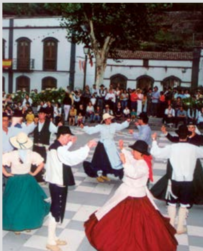
Valleseco en Fiestas

El primer domingo de Octubre tiene lugar la gran celebración de nuestro municipio, las Fiestas de la Manzana, en la que los vecinos vienen en peregrinación con sus carretas desde todos los barrios ataviados, con sus trajes típicos para ofrecer a la Virgen los productos de la tierra. Estas fiestas han sido recientemente declaradas Fiestas de Interés Turístico Regional.