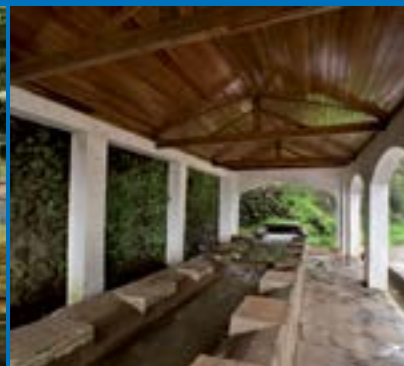
Lavaderos de Valleseco