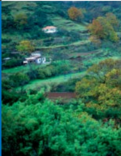
Vista de Valleseco