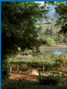
Área Recreativa de La Laguna

Situada en el mismo casco, la Iglesia de San Vicente Ferrer , es el edificio más notable de Valleseco. Fábrica sencilla y ecléctica en su estilo, erigida según proyecto de Laureano Arroyo Velasco. En su interior, encontramos una joya del siglo XVIII, un órgano de origen alemán de gran valor histórico. Enfrente podemos visitar el Molino de Gofio de más de 90 años de antigüedad aún en funcionamiento y, si desea saber algo más sobre este producto canario por excelencia, puede acercarse hasta el Museo Etnográfico y Centro de Interpretación de Valleseco (MECIV) , donde también está ubicada la Oficina de Información Turística. Aquí se puede conseguir la más tradicional artesanía de la Isla. Traperas, trajes típicos, cerámica, calados, objetos y aperos de labranza o cestas de mimbre son algunas de las valiosas piezas de artesanía que no pueden dejar de adquirirse en Valleseco. Para llevarse un buen sabor no olvide degustar la primera Sidra de Canarias elaborada con manzana reineta del propio municipio y conocer otros derivados de esta fruta como el Vinagre y la Repostería. Justo al lado de este museo, los viernes por la tarde y los fines de semana, se pueden adquirir todo tipo de productos de la tierra y pan recién hecho en el Mercadillo Ecológico de Valleseco . Además, en los restaurantes que existen a lo largo del municipio podrá conocer toda una variedad de platos de la rica cocina canaria.