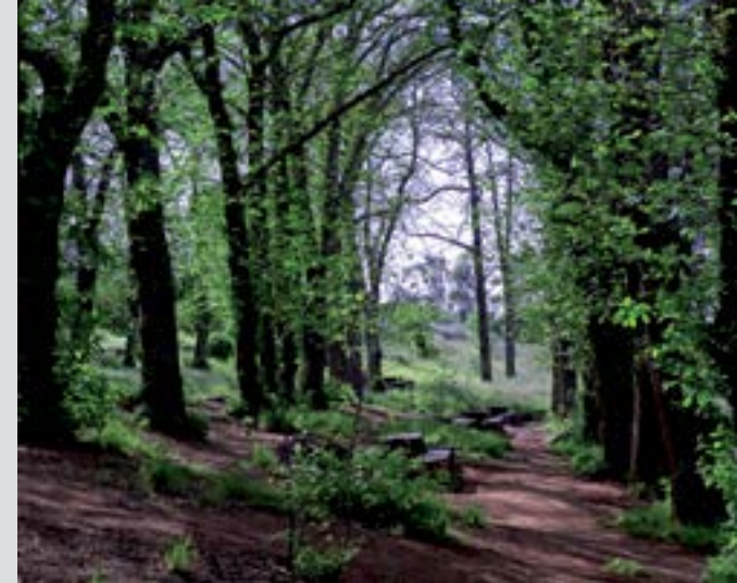
La Laguna de Valleseco

Línea 5 hasta Las Palmas de Gran Canaria Línea 216 hasta Teror y/o línea 220