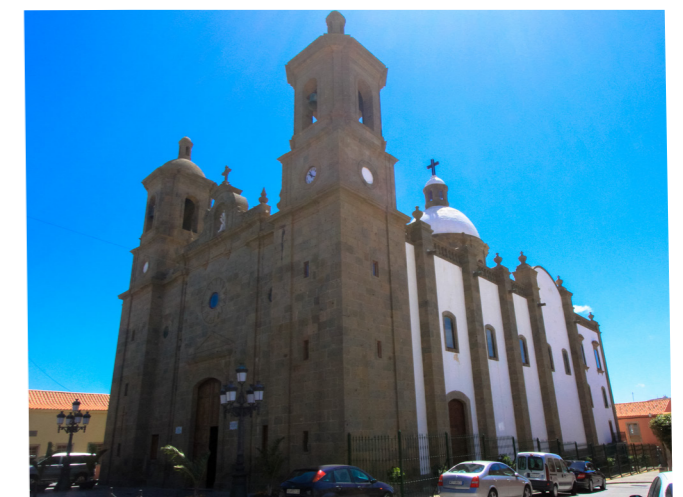
① Iglesia de planta basilical con cimborrio único en Canarias

① La iglesia es de planta basilical y consta de tres naves de igual altura, con bóvedas de medio cañón, separadas por dos series de columnas toscanas y arcos de medio punto que descansan directamente sobre los capiteles. En el crucero, sobre los arcos torales y pechinas, se levanta el cimborrio, altivo y dominante, único en Canarias, con un tambor de doce ventanales que sostiene la gran cúpula o duomo, coronada por el casquete o cupuino. Al fondo, la capilla mayor forma un ábside rectangular. La luz penetra, tamizada y sosegante, por los vitrales de las diez ventanas laterales y los grandes ventanales del cimborrio.