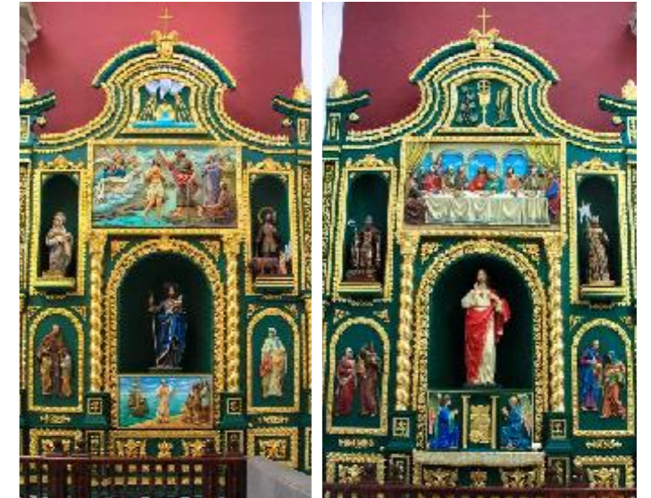
⑥ Nuevos Retablos

⑥ En los nuevos retablos situados en las naves laterales están representadas las imágenes de San Joaquín, Santa Ana, la Santa Cena, San Juan junto a su familia, San José, Santa Teresa de Calcuta, el recientemente canonizado Hermano Pedro, el bautismo de Jesús, Ntra. Sra. de la Esperanza y San Isidro Labrador.