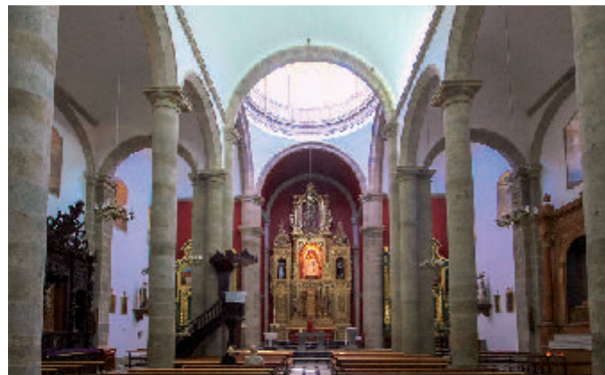
② Interior Iglesia

El ornato del templo es predominantemente barroco que contrasta con la severidad neoclásica. ③ El retablo del altar mayor, tallado y dorado, de estilo barroco, data de 1931, y se compone de un gran nicho central para la Virgen del Rosario, dos nichos laterales para las imágenes de Santo Domingo y San Vicente Ferrer, de Luján Pérez, y otro en la parte superior o ático para el Crucificado. Tiene tres cuerpos o calles, separadas por columnas salomónicas, con amplios paneles labrados y altos remates con escudos dominicanos. Abre su nicho central para la exaltación de Nuestra Señora del Rosario, y sirve de marco un precioso sagrario de planta