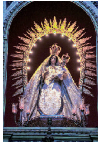
④ Nuestra Señora del Rosario

trapezoidal que se levanta en forma de prisma, con una bóveda esquinada que termina en un florón de hojas de acanto coronado por un cáliz. Las cuatro columnas salomónicas son de seis vueltas, obra de Lorenzo de Campos en 1673. Este sagrario posteriormente se convierte en manifestador, aupado sobre otro sagrario más pequeño, ganando así prestancia y grandiosidad. La importancia de este sagrario estriba en la originalidad de su estructura, en su esmerada belleza, en que, a partir de entonces se impone definitivamente el uso de la columna salomónica en Canarias.