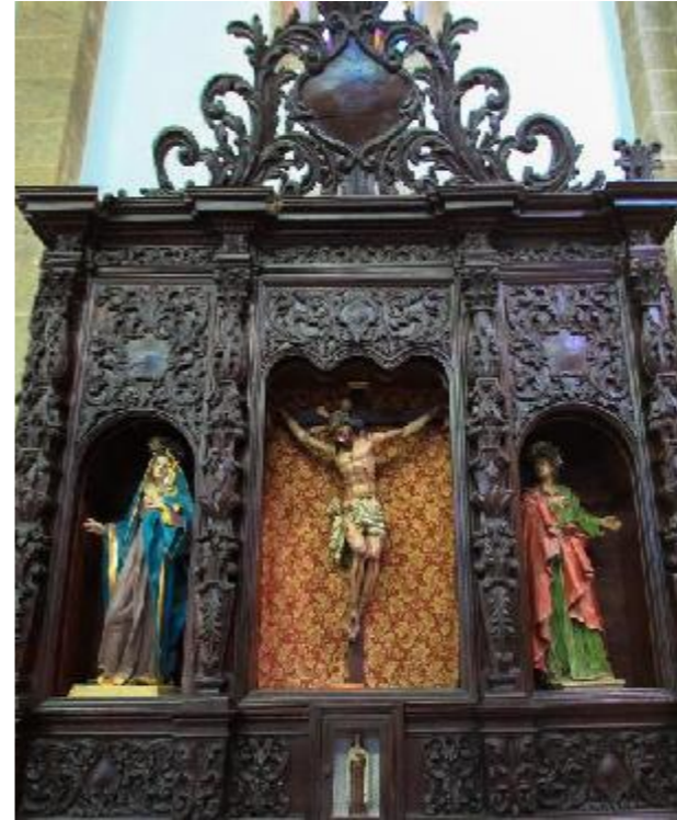
⑤ Retablo del Calvario con la Dolorosa y San Juan Evangelista