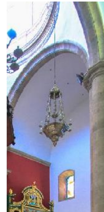
⑦ Lámpara mayor de la nave central

Además, es importante mencionar ⑦ la lámpara mayor que luce la nave central del templo de estilo barroco datada del siglo XVII. Se compone de un gran plato octogonal, con una serie de molduras lisas que descienden como un tronco de pirámide invertido y se apoyan sobre una taza redonda con tres esferas decrecientes separadas por escocias