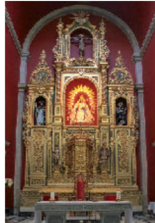
③ Retablo del Altar mayor