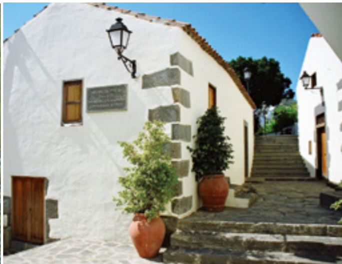
Molino de Fargas, s. XVI.