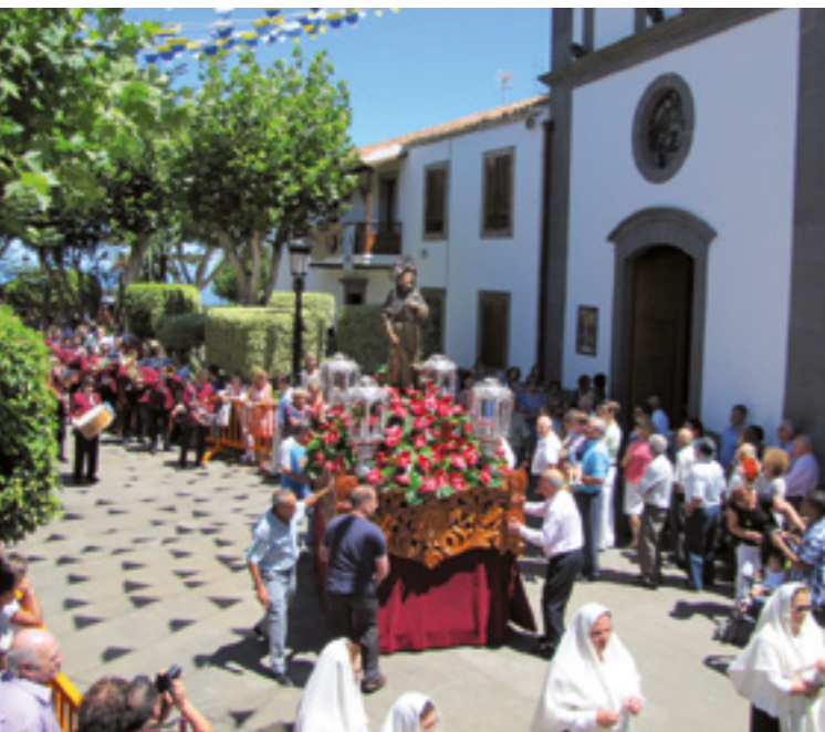
Procesión de San Roque.

La fiesta principal es la del Patrón San Roque, que tiene lugar el 16 de agosto. Durante la misma se organizan diferentes actos culturales, populares, tradicionales y religiosos, destacando de entre todos ellos La Tradicional Romería de San Roque, La Feria de Ganado, la Traída del Palo y La Noche del Tormento.