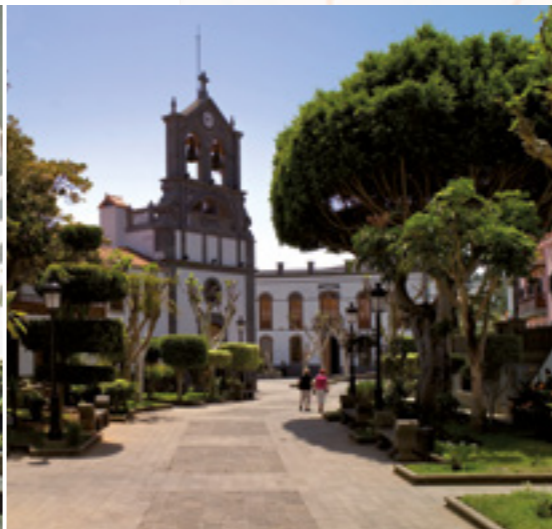
Plaza e Iglesia de San Roque.