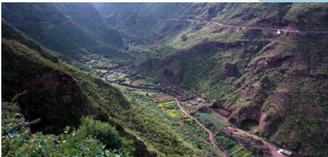
Barranco de Azuaje.

El edificio sede del Ayuntamiento de la Villa de Fargas es una casona de estilo neo-canario construida en la década de los años 40. Entre sus materiales destaca la piedra azul procedente de las afamadas canteras de la zona baja del municipio y tea de pino canario en la construcción de sus magníficos balcones. El Molino de Agua de Fargas del s. XVI , declarado BIC en el año 2007, está situado sobre la acequia de la Heredad de Aguas de Arucas y Fargas, aprovechándose de esta forma la