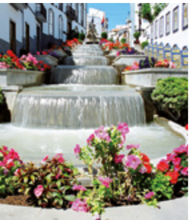
Paseo de Gran Canaria.

La Villa de Fargas está situada al norte de la isla de Gran Canaria a 28 kms de la capital. Cuenta con una superficie de 15,77 km² y está ubicada a una altitud de unos 465 mtrs sobre el nivel del mar.