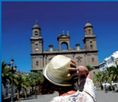
Catedral de Santa Ana