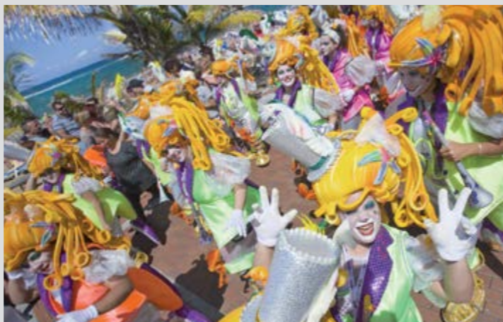
Carnaval de Las Palmas de Gran Canaria