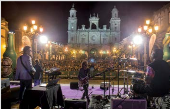
Festival de Jazz