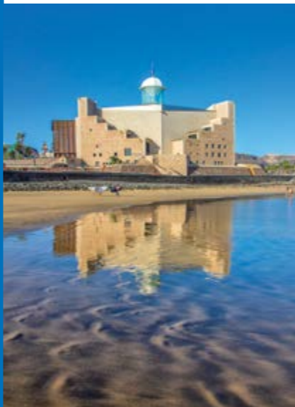
Auditorio y Palacio de Congresos Alfredo Kraus

Situado en el extremo noreste de la isla de Gran Canaria