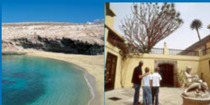
Playa de Aguadulce

La última parte de la mañana nos lleva a adentrarnos en el Conjunto Histórico-Artístico de San Francisco , donde recorreremos sus callejuelas empedradas ascendiendo junto al acueducto hasta llegar al centro de uno de los barrios más antiguos de Canarias. Entre sus calles donde parece que el tiempo se ha detenido disfrutamos de la visión de la Iglesia Conventual de San Francisco , en cuyo