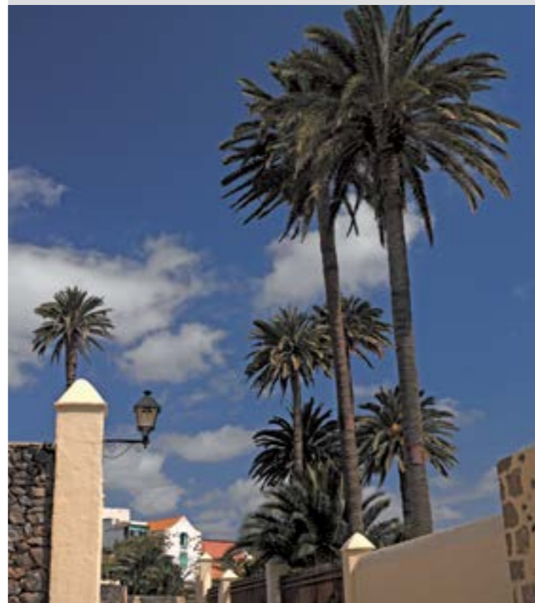
Barrio Histórico Artístico de San Francisco

Verano Campaña Súbete al verano en Telde 15 de agosto Fiesta de La Traída del Agua 14 de septiembre Fiesta del Santo Cristo de Telde 8 de diciembre Fiesta de La Caña Dulce o la Concepción