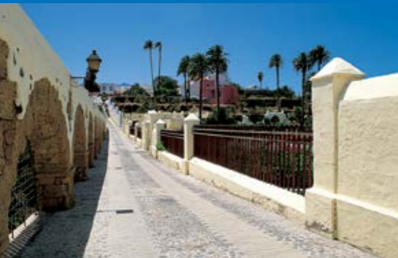
Barrio Histórico Artístico de San Francisco

Para finalizar un fantástico día, podemos contemplar el atardecer desde la costa , con un agradable paseo por la avenida marítima de nuestra costa, o simplemente disfrutando del espectáculo del mar frente al Bufadero de La Garita .