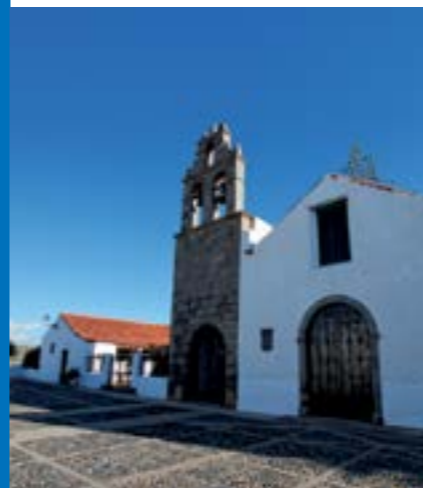
Barrio Histórico Artístico de San Francisco

Situado en el sureste de Gran Canaria, Telde se encuentra a 13 kilómetros de distancia de la capital de la Isla, Las Palmas de Gran Canaria, por la autopista del sur.