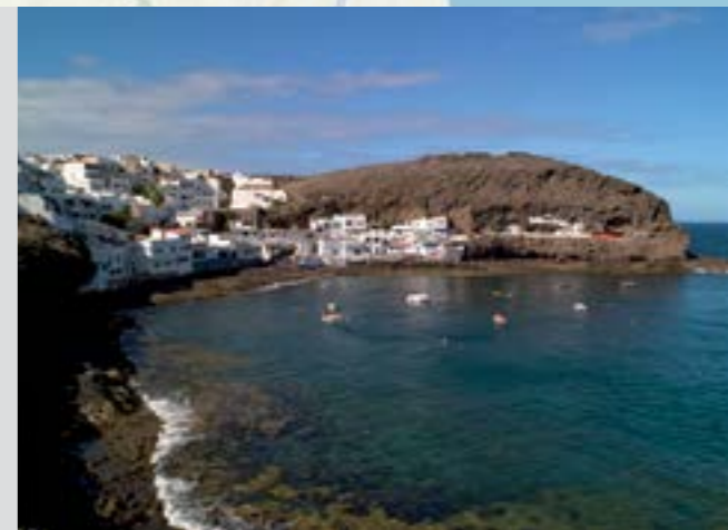
Playa de Tufía