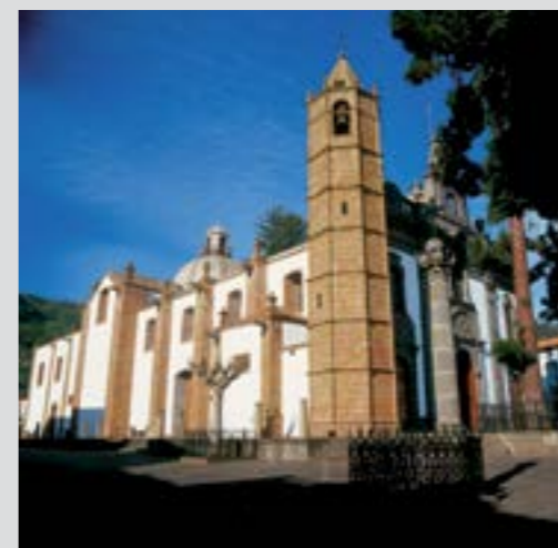
Basílica del Pino