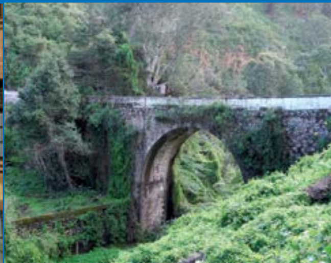
Puente del Molino