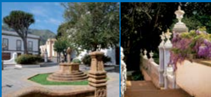
Plaza Pío XII

En el Muro Nuevo puede optar por prolongar su recorrido hasta el Convento de las Dominicas a través del Paseo González Díaz o seguir el itinerario por la Calle Real.