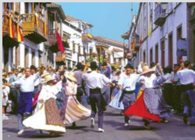
Baile en las calles

La Fiesta del Pino es la mayor Fiesta de Gran Canaria en honor a Ntra. Sra. del Pino, Patrona de la Diócesis de Canarias. Se celebra cada 8 de septiembre, aunque los actos conmemorativos se desarrollan a lo largo de todo el mes. La Fiesta del Pino transforma Teror cada mes de septiembre en un centro de peregrinación constante, principalmente los días 7 y 8 en los que los peregrinos llegan caminando desde distintos lugares de la isla.