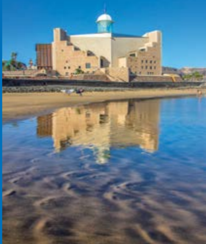
Auditorium und Kongresspalast Alfredo Kraus

Die Inselhauptstadt im Nordosten Gran Canarias