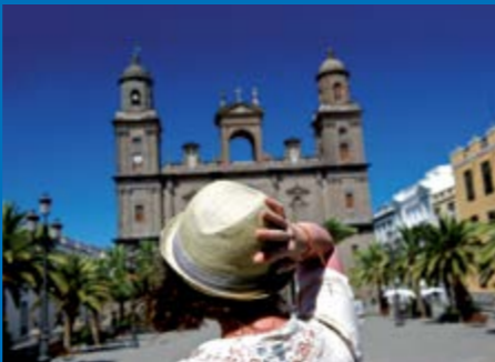
Kathedrale Santa Ana