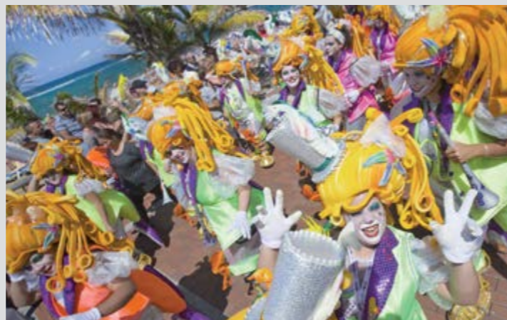
Karneval in Las Palmas de Gran Canaria

DEZEMBER: Weihnachten, Sand-Krippe am Canteras-Strand