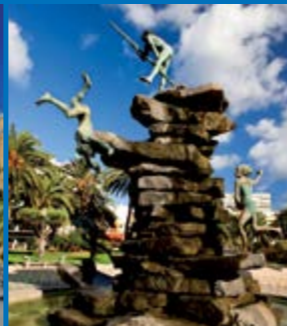
Stadtviertel Ciudad Jardín