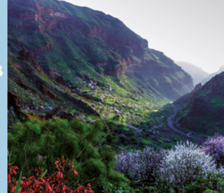
Barranco de Guayadeque.