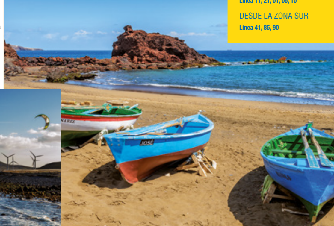
Playa del Burrero.

Municipal de Cerámica , lugar que nos abre sus puertas para hacer un recorrido por los distintos oficios artesanales que se llevan a cabo en la zona.