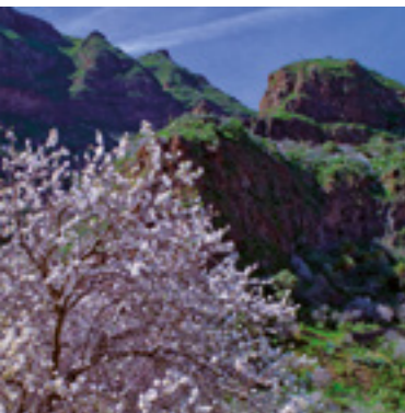
Almendro en Flor.

Ubicado al sureste en la isla de Gran Canaria.