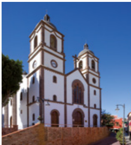
Ntra. Sra. De la Candelaria.

En el Parque de Lectura Francisco Tarajano destaca la presencia de monolitos que representan distintos acontecimientos relacionados con el municipio en un ambiente de paz y sosiego. En dirección a la Plaza de Candelaria se observa una de las diversas esculturas más emblemáticas que comprende el legado artístico de la Villa y que hablan de las tradiciones del lugar, " Las Lavanderas ", representando dos señoras lavando sus ropas en las llamadas acequias. Dicha escultura hace homenaje al esfuerzo de las mujeres en su labor de cada día. Los siguientes puntos de interés serán La Plaza de Candelaria , situada en los aledaños de la Parroquia, la cual recibe el mismo nombre y La Iglesia de Nuestra Señora de Candelaria , de la cual habría que destacar que se empezó a construir en 1901 sobre los restos de la anterior ermita del mismo nombre y de la que no quedan vestigios. Se convirtió en Parroquia el 30 de Noviembre de 1815.