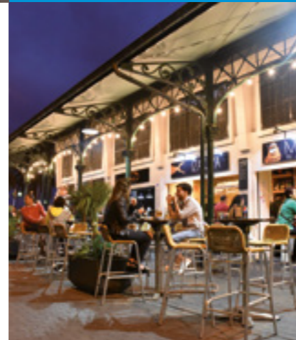
Mercado del Puerto.