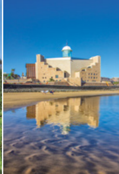
Auditorio y Palacio de Congresos Alfredo Kraus.

Las Palmas de Gran Canaria es una de las ciudades turísticas más singulares de España. La principal urbe del archipiélago canario es un destino vacacional de sol y mar, cosmopolita, abierto y amable, con una historia de más de 500 años y una agenda cultural y de ocio que no descansa los 365 días del año.