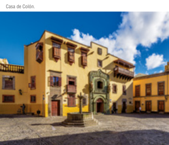
Casa de Colón.