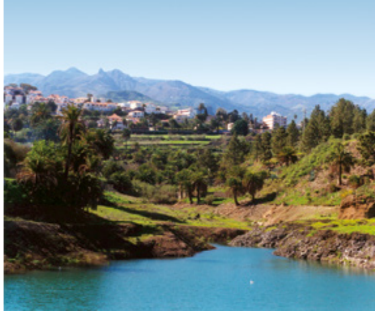
Presa de Satautejo.

Desde la Caldera nos dirigimos al barrio de La Atalaya , donde se encuentran numerosas pruebas de la pervivencia de la labor artesanal de la alfarería, consistente en la elaboración de cacharros y cuencos de barro. Podemos visitar cuevas en donde se utilizan los hornos antiguos de piedra para cocer las vasijas. También en el casco histórico del barrio de La Atalaya es posible visitar la Casa Alfár de Panchito , que fomenta el recuerdo de esta tradición, ofreciendo al