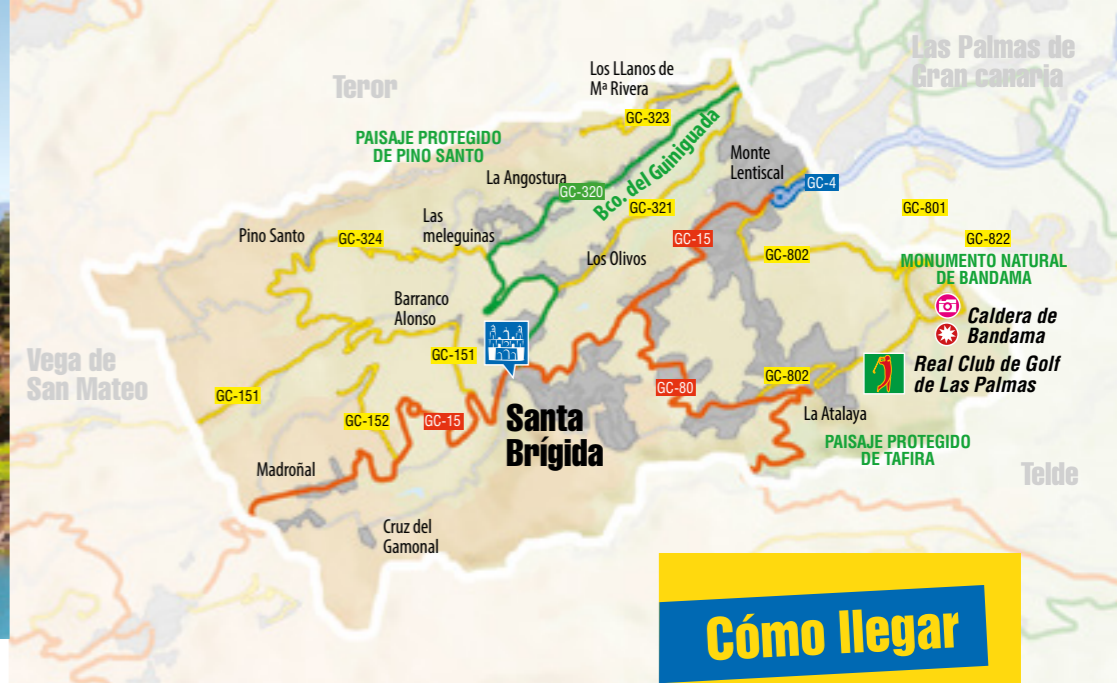
Caldera de Bandama.

paisajes de extraordinaria belleza y entre otros lugares se pueden visitar: El Parque Agrícola El Guiniguada, la Casa-Museo del Vino, así como observar edificaciones tales como la Heredad de Aguas de Satautejo y la Higuera, el Real Casino, y la Fonda de Melián.