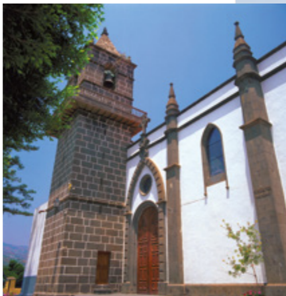
Iglesia Parroquial de Santa Brígida.