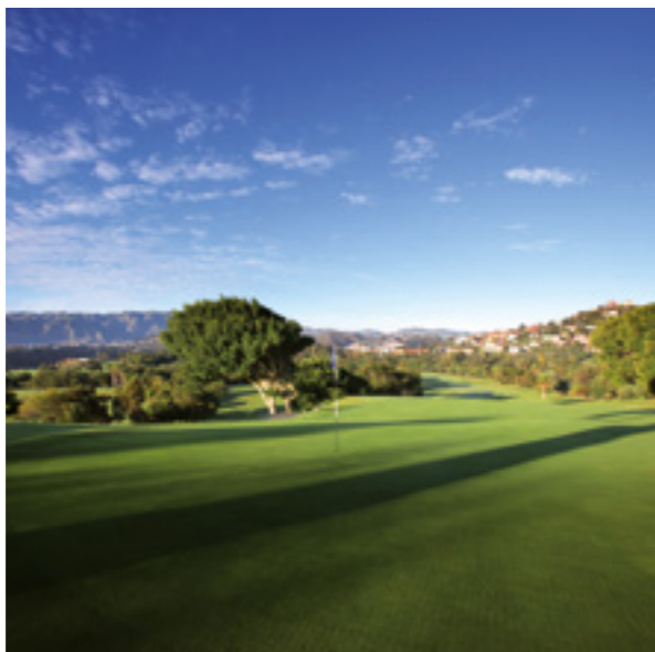
Real Club de Golf de Las Palmas.

Línea 24, línea 301, línea 302, línea 303, línea 311, línea 318, línea 331