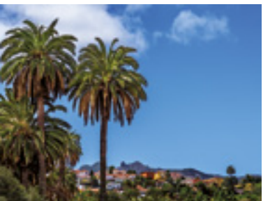
Casco Histórico de Santa Brígida.

El municipio, con una extensión de 23,8km 2 , está situado en la zona centro-oriental de la isla de Gran Canaria.