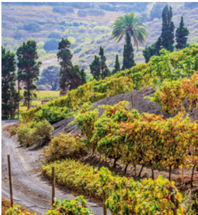
Viñedos en Bandama.

Se trata de la fiesta más antigua del municipio. En el segundo tercio del siglo XVI, la fundadora del pueblo, Isabel Guerra, dejó escrito en su testamento la celebración de una fiesta en honor a la Santa, tras edificar la primera ermita. La romería es de 1957. Se celebra el primer fin de semana de agosto con una romería ofrenda, en la que participan todos los barrios con carrozas engalanadas con motivos típicos y con romeros, magos y parrandas.