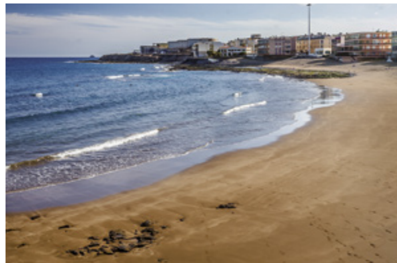
Playa de Salinetas.

Antes de afrontar una tarde de interesantes visitas a yacimientos arqueológicos tendremos que reponer fuerzas con un almuerzo que nos brinda la posibilidad de elegir entre los productos del mar en alguno de los restaurantes de la costa teldense , o los productos de la tierra de alguno de los acogedores restaurantes de suculenta comida casera en el interior del municipio.