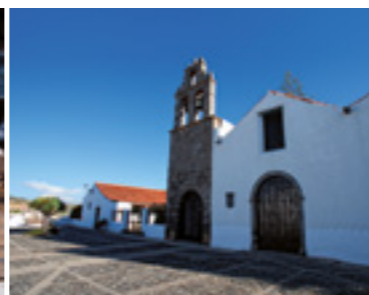
Barrio Histórico Artístico de San Francisco.

La última parte de la mañana nos lleva a adentrarnos en el Conjunto Histórico-Artístico de San Francisco , donde recorreremos sus callejuelas empedradas ascendiendo junto al acueducto hasta llegar al centro de uno de los barrios