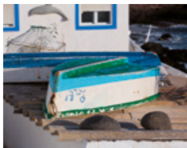
Barcas en Tufia.

A continuación nuestro paseo nos lleva a visitar la zona fundacional de San Juan , actualmente centro administrativo y judicial del municipio. Este barrio de casas señoriales convierte el paseo en una experiencia muy gratificante por la riqueza y variedad arquitectónica de casas y edificios que combinan la sencillez del mudéjar con el resto de estilos. Le proponemos dedicar un tiempo a la Alameda y la Basílica de San Juan Bautista , donde encontramos una gran variedad de obras de arte. Destacando al Santísimo Cristo de Telde del altar Mayor de origen mejicano y realizado con pasta de