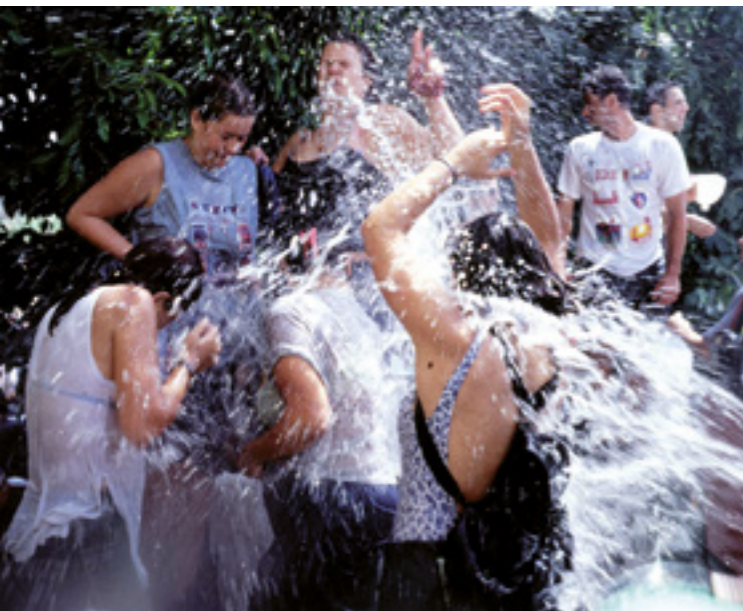
Fiesta de La Traída del Agua.