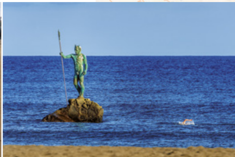
El Neptuno, playa de Melenara.