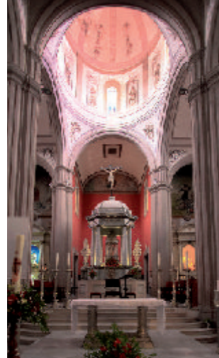
③ Altar Mayor

El conjunto de retablos, situados en cada una de las capillas, se realiza a partir de mediados del siglo XIX. Estilísticamente, oscilan desde el neoclásico tardío hasta el eclecticismo. ③ Destaca el templete del Altar Mayor y los retablos del ④ Patrón Santiago de los Caballeros y la ⑤ Purísima Concepción , estos últimos gemelos y realizados en 1866, del más elegante neoclásico. En el año 1865 se realizaron los retablos de la capilla de Ànimas y del Santo Cristo de Indias. En el año 1887 se realiza el neogótico de San José, confeccionando años siguientes el de San Miguel. Los retablos de Nuestra Señora de los Dolores y Nuestra Señora de la Encarnación son obra del guineño José Rita.