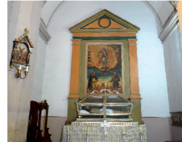
⑦ Capilla de Armas y detalle

En la Capilla de la Inmaculada Concepción se aprecia la imagen de la Purísima, obra de Luján Pérez. El retablo de la capilla es de estilo neoclásico realizado en madera pintada imitando mármol. En la Capilla del Sagrado Corazón de Jesús se pueden observar las imágenes de la Milagrosa y San Miguel Arcángel, muy antigua. La Capilla de Ntra. Sra. del Rosario contiene las imágenes de San Antonio María Claret, Ntra. Sra. del Rosario, de Luján, San Antonio de Padua y la Sagrada Familia. Junto a la Puerta del Sol o de San Antonio Abad, encontramos un marco de lienzo de San Antonio Abad, de pintor desconocido.