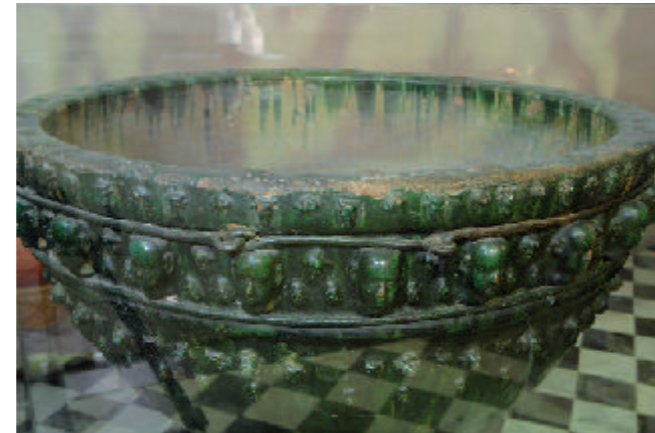
⑥ La pila verde

El Templo de Gáldar, posee en su interior 15 capillas. En la Capilla del Baptisterio se encuentra ⑥ la "pila verde" de cerámica vidriada traída de Andalucía en 1485 por Pedro de Vera. La pila nueva fue traída de Marsella en el siglo XIX. También se encuentra un marco de lienzo del Bautismo del Señor en el que aparecen San Juan y un Ángel, del siglo XVII. En la Capilla del Calvario se puede apreciar la imagen del Santísimo Cristo de Indias que fue traído desde la isla de Cuba en 1827. También se encuentra Nuestra Señora de la Soledad, de escuela canaria del siglo XVII. La imagen del San Juan Evangelista es de escuela contemporánea y fue realizada por el escultor galdense Juan Borges Linares. En la Puerta del Viento o Capilla de la Santísima Trinidad se puede apreciar un lienzo con este mismo motivo de 1600. En la Capilla de Los Dolores encontramos la imagen de Nuestra Señora de los Dolores obra de José Luján Pérez. La Capilla de San José. La Capilla de Ntra. Sra. De Candelaria donde se encuentra la imagen homónima, una imagen de Santa Ana, copatrona de la Real Ciudad de los Caballeros de Gáldar, la imagen de Santa Lucía de la escuela canaria del siglo XVII.