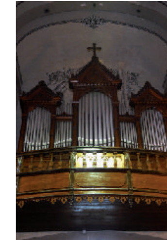
⑧ Órgano y detalle

Entre otras pinturas no mencionadas que pueden contemplarse en este templo destacan cuatro obras por su carácter diferente. Por su calidad, el lienzo de Santa Catalina de Alejandría, pintura barroca. Por tamaño, el de la Santísima Trinidad, que formaría parte de un lienzo-retablo de la capilla homónima