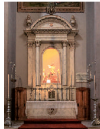
④ Retablo del Patrón Santiago.

Entre los elementos de orfebrería hay que señalar la rica custodia procesional del Corpus Christi, obra rococó del siglo XVIII, debida al orfebre cordobés Damián de Castro. Del siglo XVI, destaca el "cáliz de Santiago", de estilo plateresco, al igual que los dos pares de zapatillas del "Niño de los Reyes Católicos".