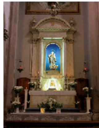
⑤ Retablo de la Purísima Concepción

De América proceden las lámparas del Santísimo, hoy en la capilla de la Purísima Concepción, y el cáliz criollo mexicano. Pieza importante es la Cruz procesional, transición del gótico al renacimiento, obra de primorosa labra, de las más importantes de todo el Archipiélago. El altar mayor está presidida por el Cristo, imagen con rasgos góticos, que debe datar del siglo XVI, del primitivo templo. Posee un majestuoso tabernáculo-templete y en su parte superior se encuentra la cúpula, uno de los rasgos característicos de este templo jacobeo. Detrás del tabernáculo se encuentra el antiguo coro, compuesto de siete asientos de tea. Al fondo del altar mayor y tabernáculo puede observarse el fresco de la Santísima Trinidad.