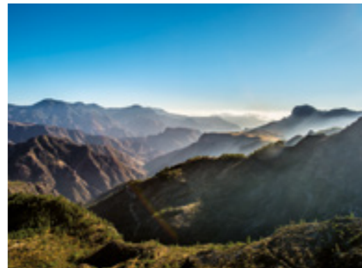
Vista Parque Natural de Tamadaba.

Siguiendo por la calle hacia la Iglesia nos encontramos con El Balcón de Unamuno y el Mirador de la Esquina . El Balcón de Unamuno fue construido en 1999 para conmemorar la estancia del ilustre escritor y filósofo español en 1910. Desde estos lugares estratégicos podemos contemplar la impresionante Caldera de Tejeda, atravesada por barrancos y en cuya parte