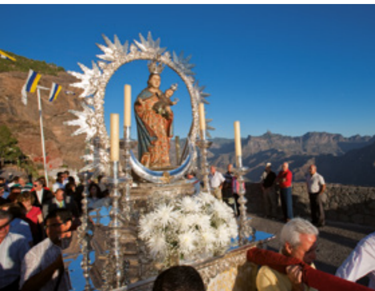
Virgen de la Cueva.

Desde comienzos del siglo XVIII se celebra esta fiesta el 14 de septiembre en el barrio de Acusa, congregando a numerosos romeros que acuden a cumplir sus promesas. Y por último, pero no menos importante, es la Candelaria de Acusa. Se celebra el segundo domingo de octubre, devoción arraigada desde el siglo XVII.