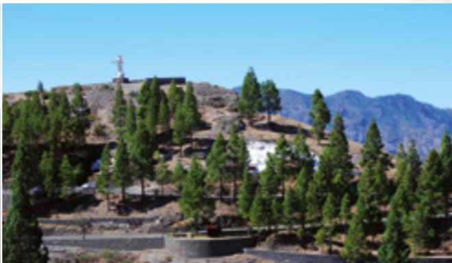
Escultura del Sagrado Corazón de Jesús.