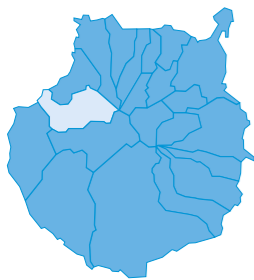
Situado en la cumbre de la isla.

Cuando el visitante llega a Artenara le apetece aparcar el coche y realizar un breve paseo por el pueblo más alto de Gran Canaria. El vehículo lo puede dejar en cualquiera de los aparcamientos que bordean las calles del pueblo y para hacerse una idea del lugar donde se encuentra y sacarle el mayor rendimiento posible a su visita, lo más recomendable es dejarse aconsejar en la Oficina de Información Turística.