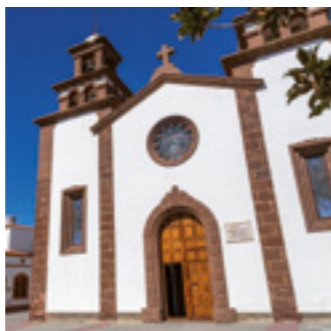
Iglesia de San Matías.

Cuando el visitante llega a Artenara le apetece aparcar el coche y realizar un breve paseo por el pueblo más alto de Gran Canaria. El vehículo lo puede dejar en cualquiera de los aparcamientos que bordean las calles del pueblo y para hacerse una idea del lugar donde se encuentra y sacarle el mayor rendimiento posible a su visita, lo más recomendable es dejarse aconsejar en la Oficina de Información Turística.