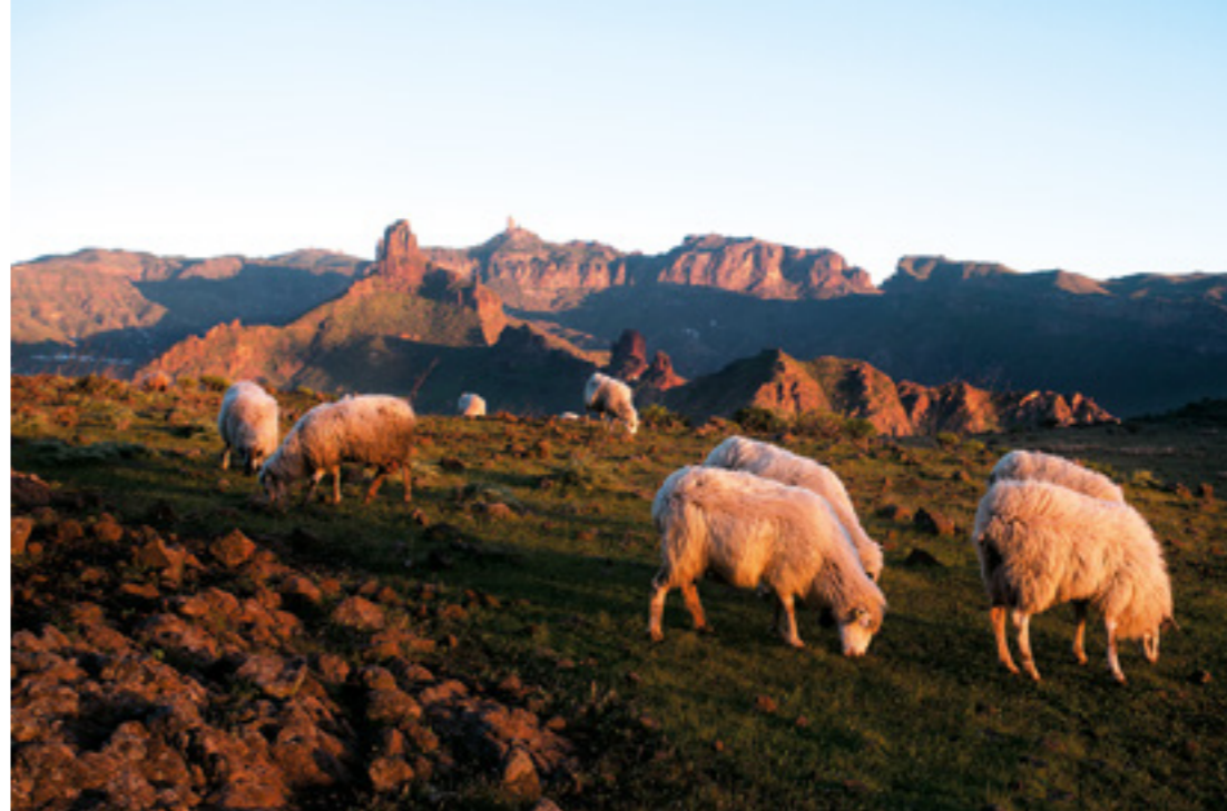
Llano de Acusa Verde con los Roques de Bentayga y Nublo al fondo.